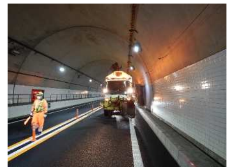
トンネル内側壁の清掃をおこないました