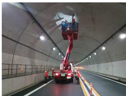
トンネルの上部などの点検をおこないました